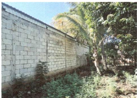
Foto 12: VISTA EXTERIOR Muro de aulas seran tratadas a base de alizado de cemento por filtracion de agua.

Hueguilob Firma y sello del Presidente del Consejo Educativo