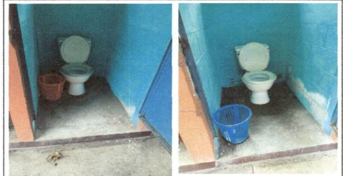
Foto 4: MODULO A Colocacion de piso ceramico sobre base de concret en mal estado y colocacion de azulejo en muros.