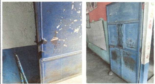
Foto 8: MODULO B Mantenimiento de 2 puertas de metal mas cambio de chapas en mal estado.