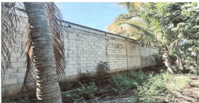
Foto 11: VISTA EXTERIOR Muro de aulas seran tratadas a base de alizado de cemento por filtracion de agua.