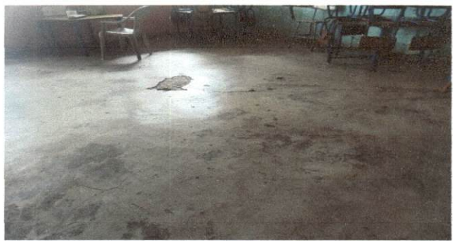
Foto 10: MODULO B Colocacion de piso sobre base de concreto en mal estado.