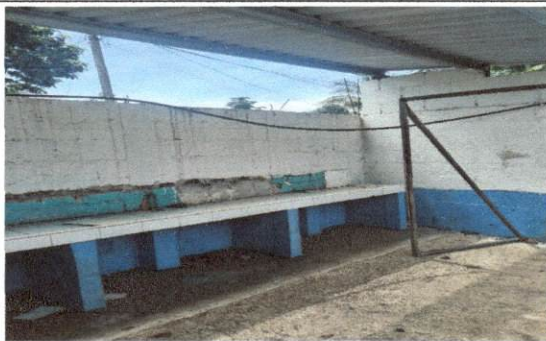
Foto 5: Vista de area para aperturar puerta de 2.0 mts x 2.0 mts para accesar niños de pre primaria.